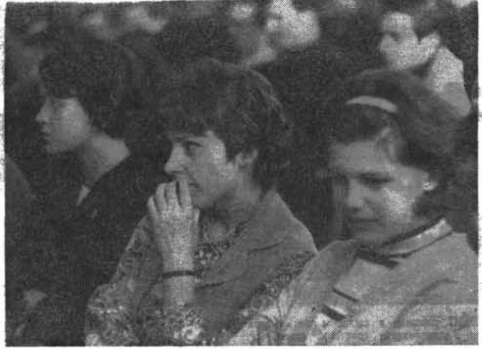
ДЛЯ ПРОВЕДЕНИЯ СЛЕТА ОТЛИЧНИКОВ УЧЕБЫ ПОТРЕБОВАЛСЯ АНТОВЫЙ ЗАЛ ГЛАВНОГО ИНСТИТУТСКОГО КОРПУСА. ОТЛИЧНИКОВ В ИНСТИТУТЕ — МНОГО, А ДОЛЖНО БЫТЬ ЕЩЕ БОЛЬШЕ!