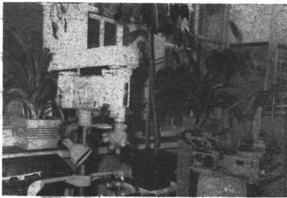
В ЛЮБОЕ ВРЕМЯ ГОДА В УЧЕБНОЙ ЛАБОРАТОРИИ КАФЕДРЫ ТЕХНОЛОГИИ ПРИРОДОУСТОЙЧИВОСТИ ЗАБОТЛИВО УХОЖЕННЫЕ КОМНАТНЫЕ РАСТЕНИЯ.

З ИМА НЫНЧЕ выдалась студенкой. Январь в этот году — месяц лютых морозов и холодного солнца. Нам, людям, не хочется выходить из теплого дома. А как же птицам? Все труднее добывать насекомых из запорошенных снегом