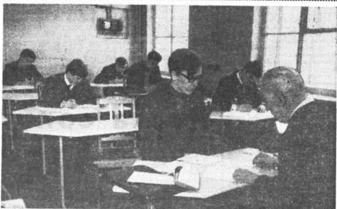
Экзаменационный фотозкран. Студенты 444-й группы на экзамене по курсу «Электронные устройства в автоматике» (снимок слева). Экзамен по политической экономии на ФТМВИ (снимок справа).