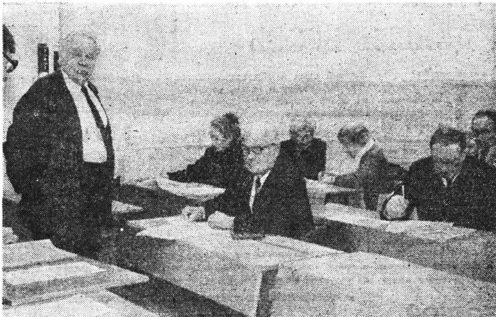
На собрании блокадников.