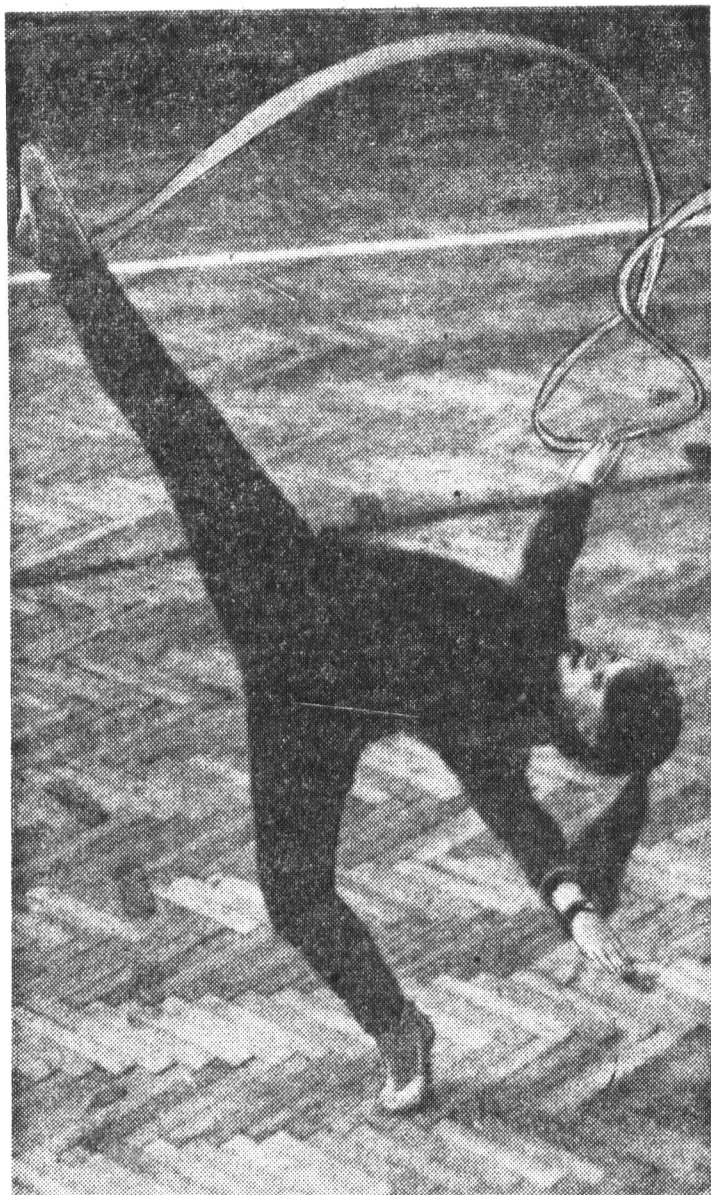
Секция художественной гимнастики пользуется особой популярностью у студенток. Многие из гимнасток добились здесь высоких спортивных разрядов Фото Ирины Васильевой.

Ордена Трудового Красного Знамени типография им. Володарского Ленинград, Ленинград, Фонтанка, 57