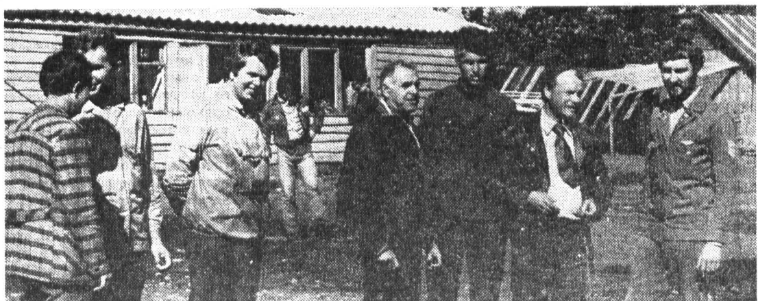
В сельхозотряде инженерно-физического факультета в дни уборочной страды.