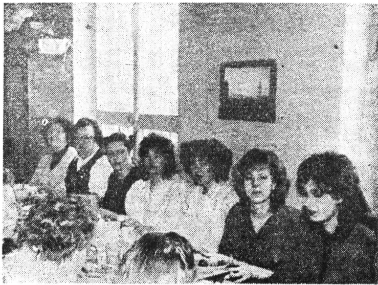
Дружки во всем.