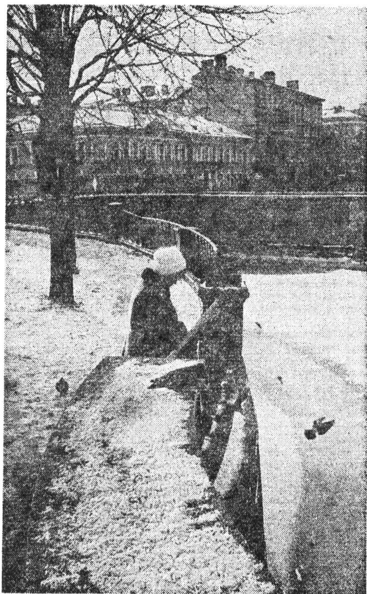
Наш город.