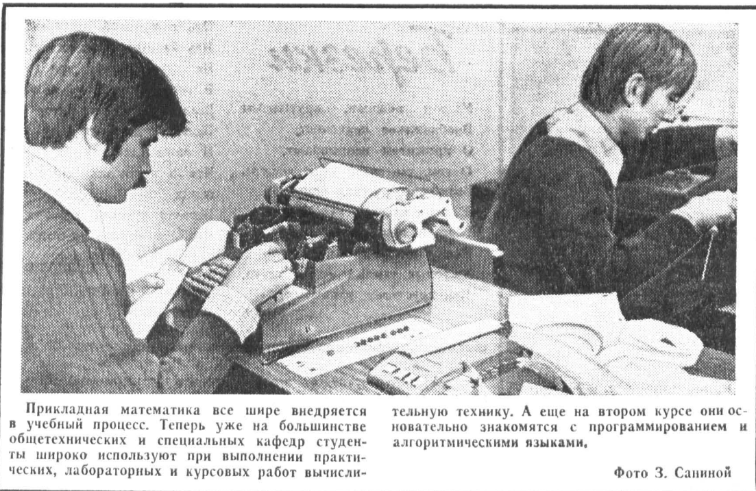
Прикладная математика все шире внедряется в учебный процесс. Теперь уже на большинстве общетехнических и специальных кафедр студенты широко используют при выполнении практических, лабораторных и курсовых работ вычис-

Ответ этот говорит о многом. Именно «пишем», а не программируем или разрабатываем, а «писать» в данном случае ближе