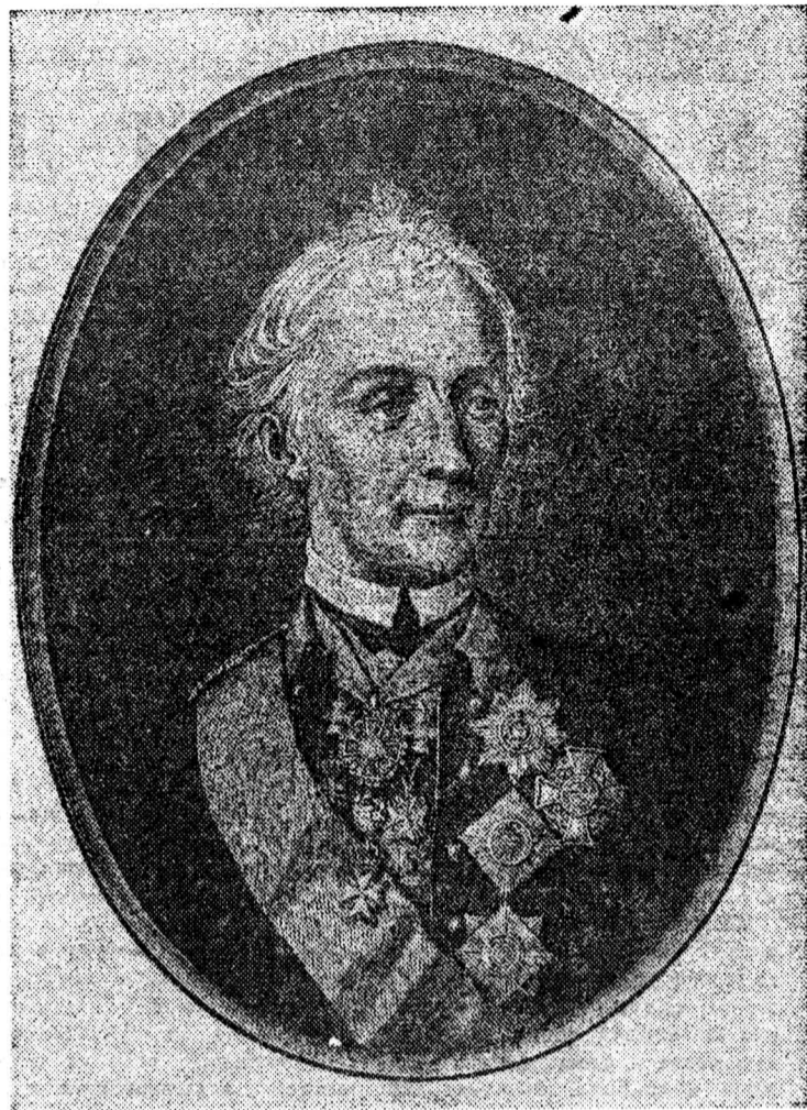
Русский полководец генералиссимус А. Суворов.

Был в истории России и еще один орден, никогда не являвшийся российским, но которым некоторое время награждались российские подданные. Это «Иерусалимский, Родосский, Мальтийский державный военный орден госпитальеров св. Иоанна». Первые упоминания об этом ордене датируются IV веком нашей эры. Официально он был учрежден в 1098 году. Орден защищал паломников — христиан, идущих к гробу господню, воевал с мусульманами во