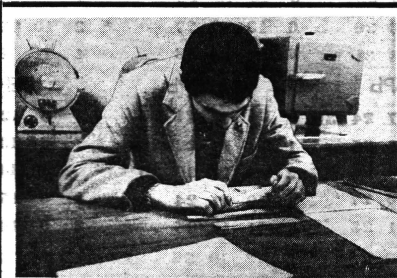
На кафедре материаловедения второкурсники инженерно-физического факультета защищают лабораторные работы по системе безмашинного контроля «Логика».