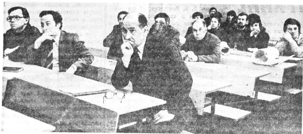
На XXV научно-технической конференции профессорско-преподавательского состава института. Заседание секции автоматизации процессов проектирования и производства.

Проведение в институте подобных работ позволило планомерно наладить работу по подготовке кандидатов и докторов наук. Так,