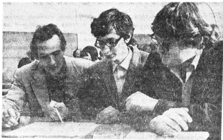
На вступительных экзаменах по математике.