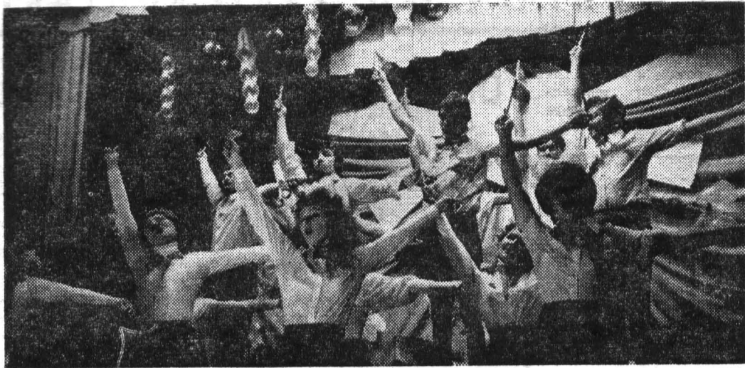
Выступление самодеятельности ФТМВТ на вечере, посвященном Международному дню студентов.