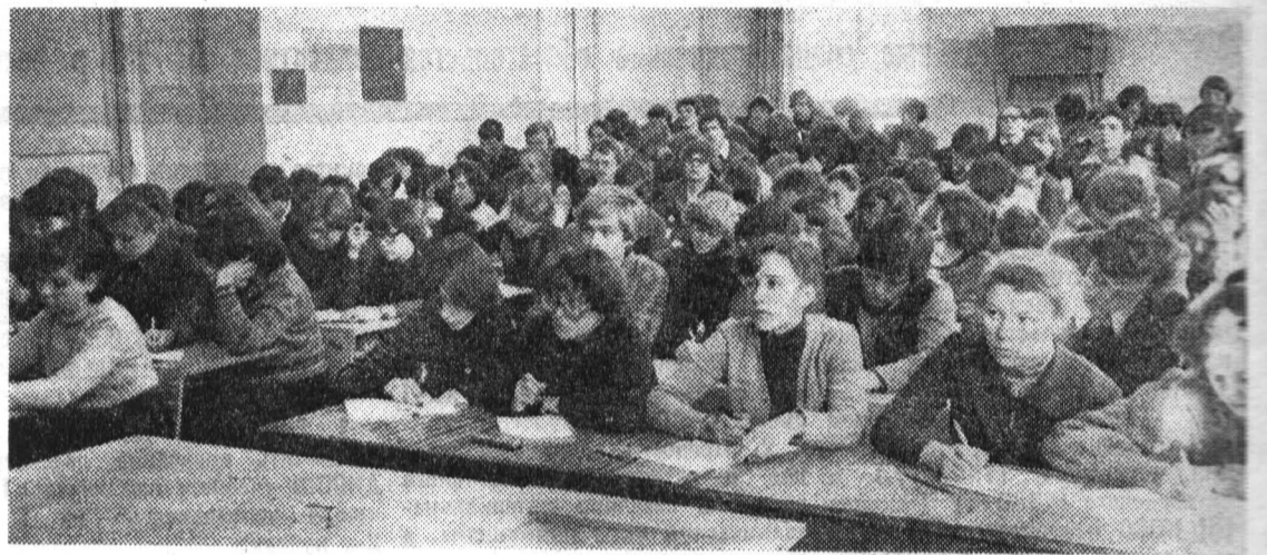
Первокурсники факультета точной механики и вычислительной техники на лекции по высшей математике.

НЕВЕРОЯТНО широко используются оптические приборы — на земле и в ее недрах, в океанских глубинах и в космосе. Без современных оптических приборов не было бы кино и телевидения. А скольким людям оптика фактически возвратила зрение! Что бы люди делали без очков — трудно даже представить! А медицина, которая немаловажна без микроскопа!