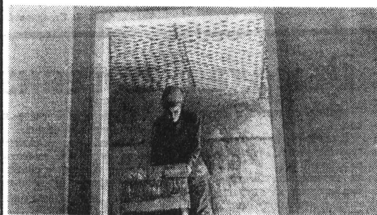
Из фотолетописи ССО-80. Отряд «Зодиак». Конкуре штукатуров.

Подписка на газету ЦК КПСС «Социалистическая индустрия» не ограничена.