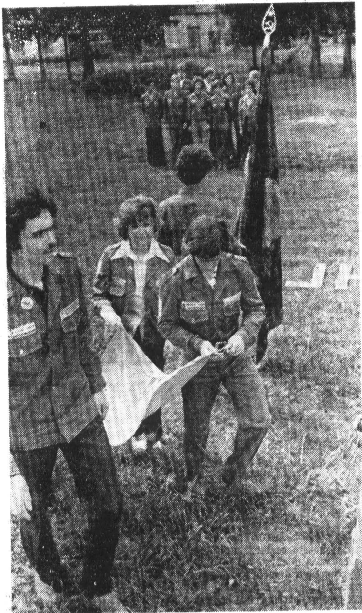
Церемониал подъема отрядного флага на торжественной линейке в ССО «Викинг».