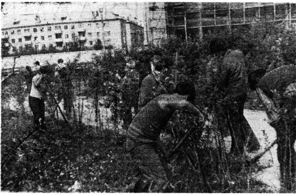
Бойцы ССО «Норд» на субботнике в Сыктывкаре.