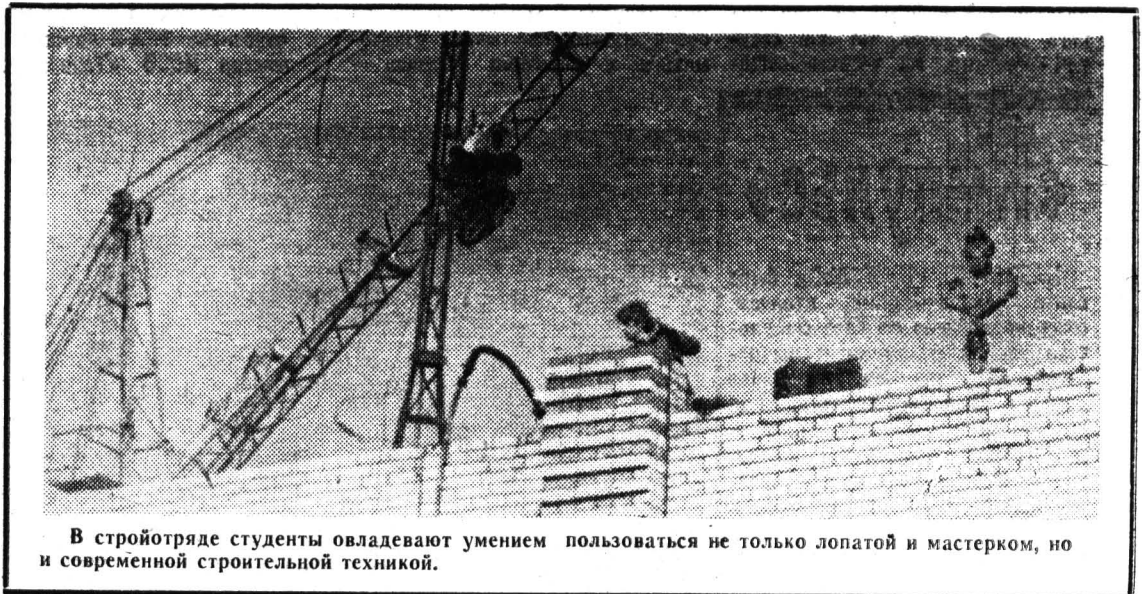
В стройотряде студенты овладевают умением пользоваться не только лопатой и мастерком, но и современной строительной техникой.

Не секрет, что рабочая обстановка, дружеская атмосфера и взаимопонимание в отряде зависят только от нас самих. Для тех студентов, которые еще не успели подать заявления в ССО, более подробно расскажу о штабе отряда «Фанел-80».