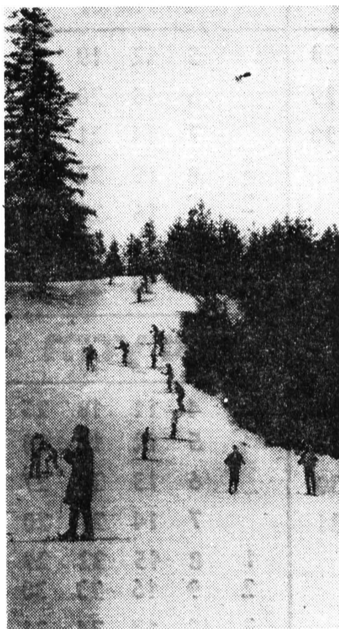
Лыжная вылазка на Карельский перешеек.