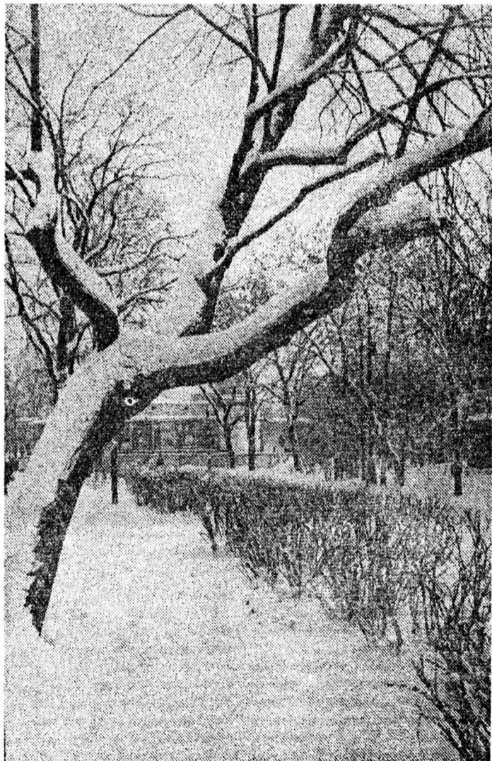
Фотохуд. Э. СТЕПАНОВОЙ