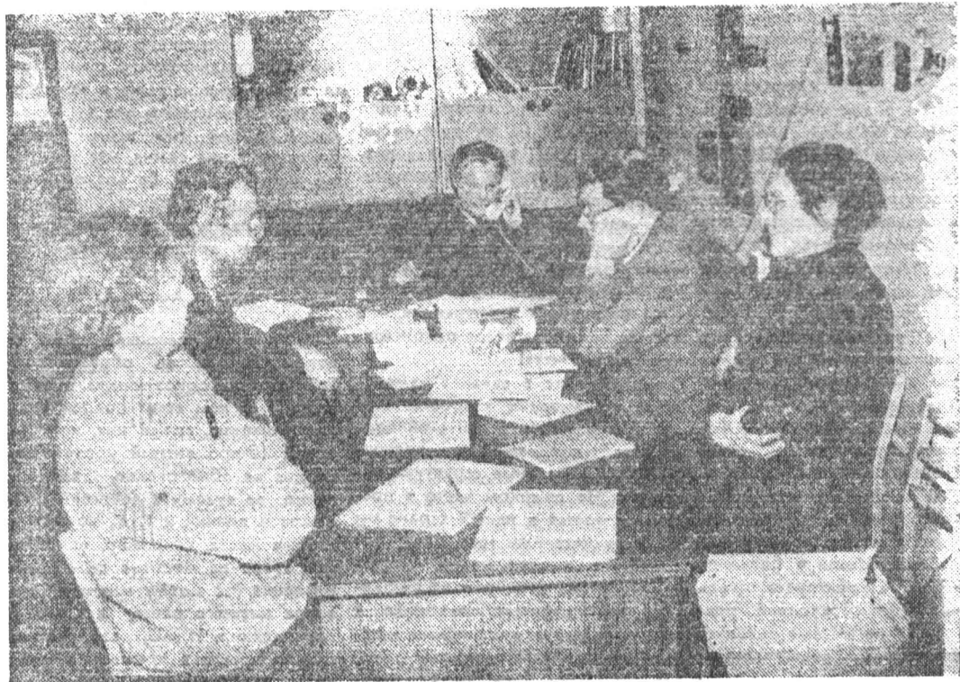
Заседание кафедры информационно-измерительных систем оптического приборостроения проводит доктор технических наук, профессор, член Академии наук РСФСР Г. Лебедко.