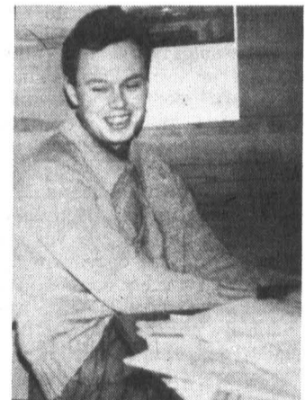
Интервью брала Ирина Селиванова.

Год уходящий будет для меня памятен межвузовской олимпиадой, которая проходила в Пензе. Команда ИТМО заняла в ней третье место. Оценивая свой результат, могу сказать, что я им не доволен — мог бы выступить лучше. Но олимпиада запомнится надолго — было интересно.