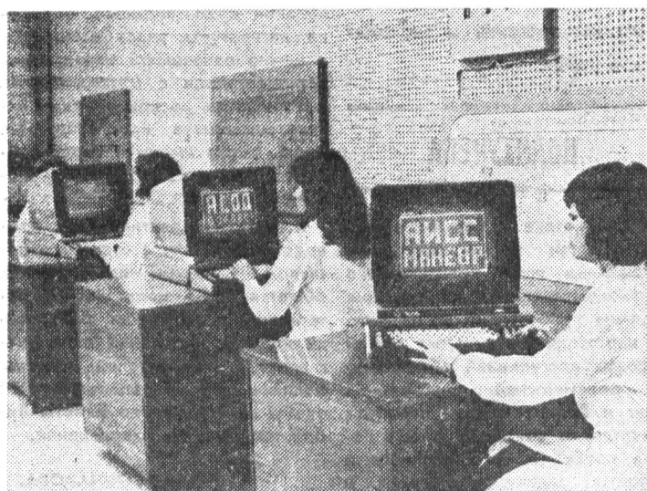
Учебные будни. Занятия в дисплейном классе.

Чаще всего предоставляется первоочередное право на обеспечение путевками в детские сады, пионерские лагеря, садовыми участками, приобретение легковых автомобилей и других дефицитных товаров. Во многих случаях отличившихся выдвигают в первую очередь на получение государственных наград, присвоение почетных званий данного предприятия, занесение в Книгу почета. Заслуживает одобрения практика дифференцированного поощрения с учетом интересов разных категорий работников — молодежи, ветеранов труда.