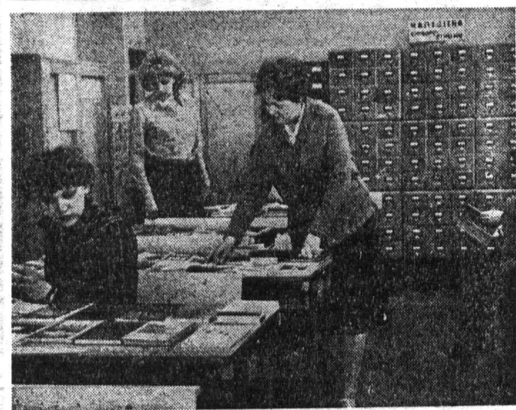
Самостоятельная работа студента требует постоянного ознакомления с новейшей литературой по избранной специальности.