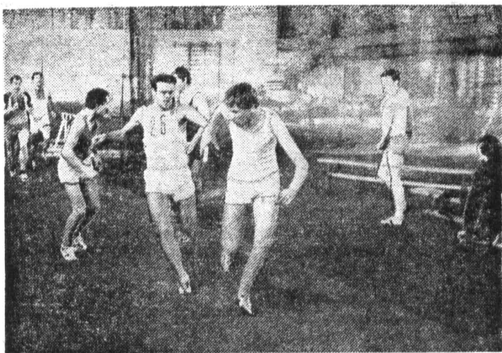
На студенческих легкоатлетических состязаниях в зимнем манеже.

ФЕВРАЛЬ И МАРТ — непростые месяцы для студентов. Именно в эти месяцы проходят главные экзамены — выпускники защищают дипломные проекты, подводится итог многолетнего обучения в институте. Но не дип-