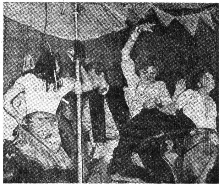
На конкурсном вечере факультета точной механики и оптики.

Следует отметить и другие результаты наших легкоатлетов на этом чемпионате. Третьим