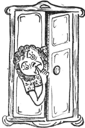
Так недолго до кошмара: Распахнулся шкаф в момент, И на свет выходит Мара — Нелегальный элемент.