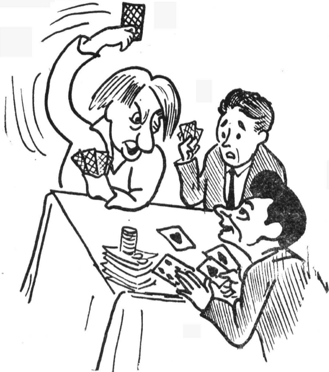
Студентам этим не в обузу Приобретенных знаний груз.