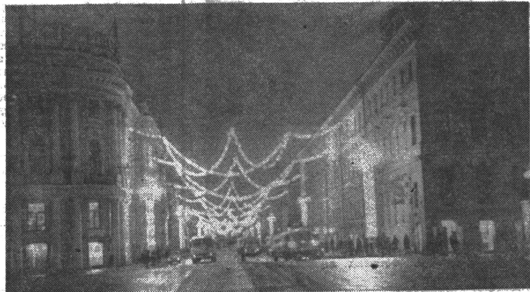
ГОРОД В ПРЕПРАЗДНИЧНОМ УБРАНСТВЕ.