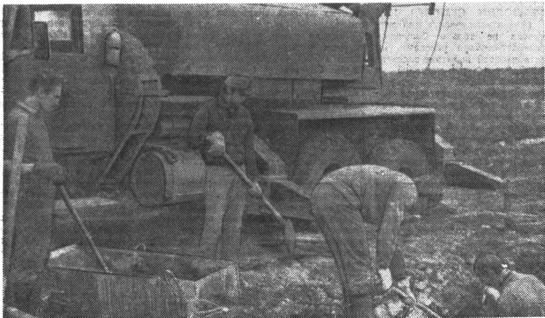
Из фотолетописи ССО-72. Набережные Челны. Бригада литмонавтов подготавливает фундамент на строительстве клуба.