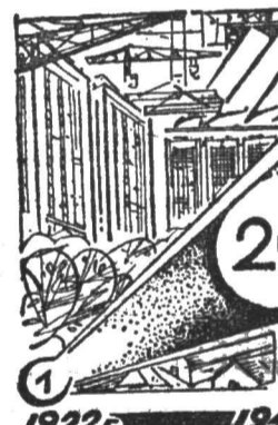
Рост капитальных вложений

Капитальные вложения в народное хозяйство в 1918