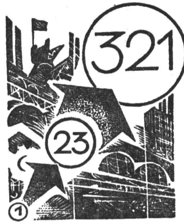
Рост продукции промышленности (1922 г.—1).

Машины все шире применяются на полях и фермах. Они облегчили труд земледельца, сделали его более производительным. Годовая производительность труда во всем сельском хозяйстве СССР в 1971 году увеличилась по сравнению с дореволюционным периодом в 5,4 раза, часовая производительность труда возросла более чем в 6 раз. Такие виды работ, как пахота, сев зерновых, хлопчатника, сахарной свеклы, уборка зерновых и силосных культур, сегодня полностью механизированы. 64 процента молочного стада колхозов и совхозов переведено на механическое доение, 71 процент ферм крупного рогатого скота и 83 процента свиноферм имеют водоснабжение.