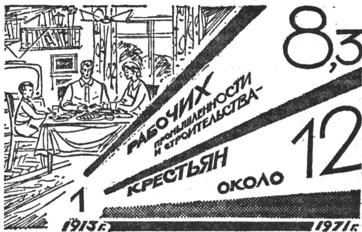
Увеличение реальных доходов трудящихся (1913 г.—1).