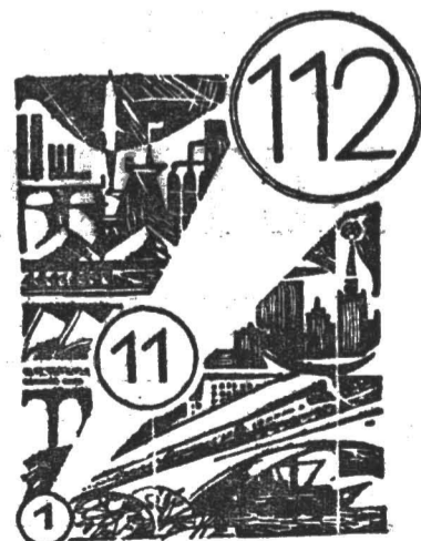
Рост произведенного национального дохода (1922 г.—1).

В настоящее время Советский Союз превзошел США не только по среднегодовым темпам прироста промышленной продукции (за 1951—1971 годы они составляли соответственно 10 и 4,2 процента), но и по абсолютному приросту выпуска многих важных видов продукции. В 1971 году у нас