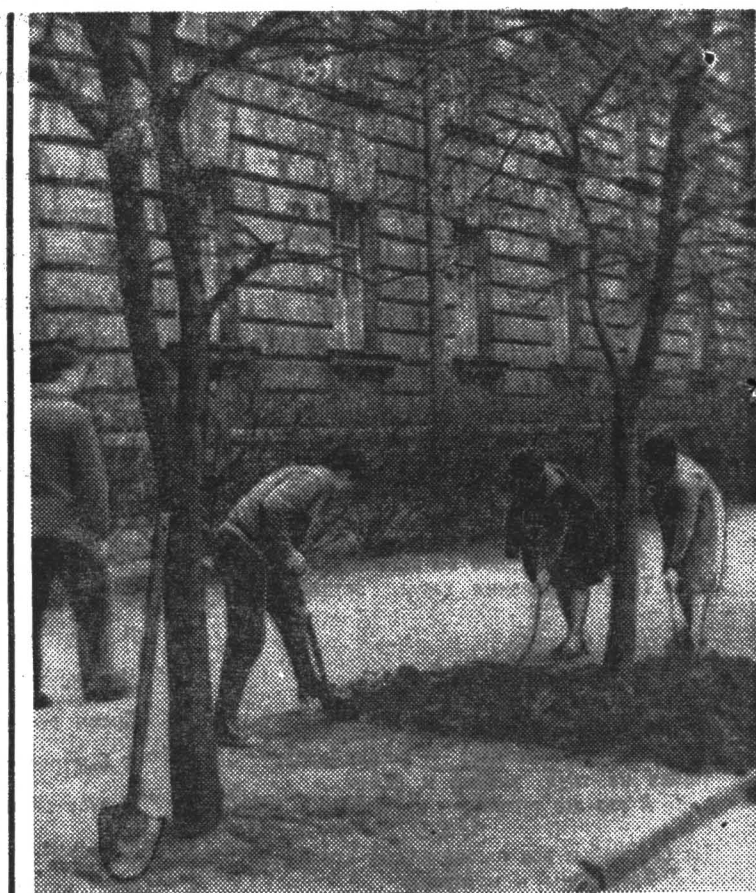
Весенние заботы студентов обещания. Хочется, чтобы возле своего дома всегда зеленела свежая трава.

яющиеся настроения человека, ту неуловимую эмоциональную среду, в которой он живет. А как прозорлива ирония Ватто, которой наделены многие его персонажи. Одно из самых проникновенных произведений XVIII века — «Савояр» Ватто. Добродушный рыжий мальчик из Савойи с флейтой путешествует по стране в поисках заработка, вокруг — безлюдный пейзаж, и окна домов кажутся незрячими, а небо — такого холодного пронзительно-синего цвета, что вся небольшая с таким искусством написанная картина вызывает тревогу и беспокойство за человеческую судьбу. 250 лет назад работал Ватто, но он глубоко повлиял не только на художников своего века, что хорошо видно на выставке «Ватто и его время», которая только что открылась в Эрмитаже.